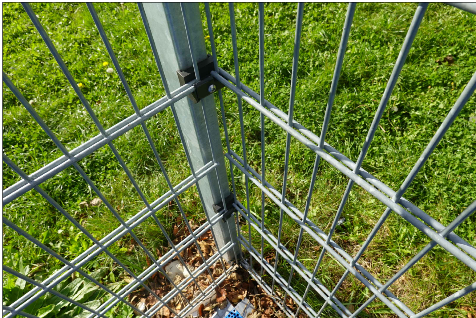
UCHYCENÍ NA ROHOVÉM SLOUPKU