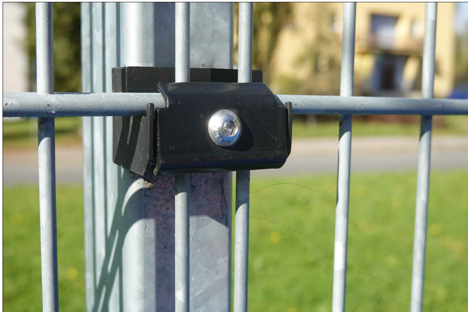
DETAIL UCHYCENÍ V POLI