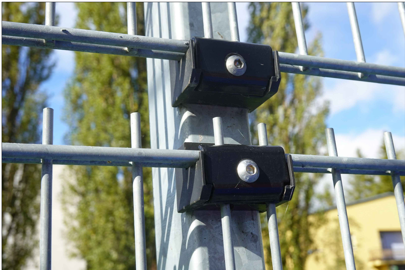
ZDVOJENÉ UCHYCENÍ VE VÝŠCE 2,00 M

OBJEDNÁVKA SYSTÉMOVÉHO OPLOCENÍ MUSÍ ZAHRNOVAT I MONTÁŽNÍ MATERIÁL VČETNĚ UCHYCENÍ A PODLOŽEK POPIS VIZ TECHNICKÁ ZPRÁVA